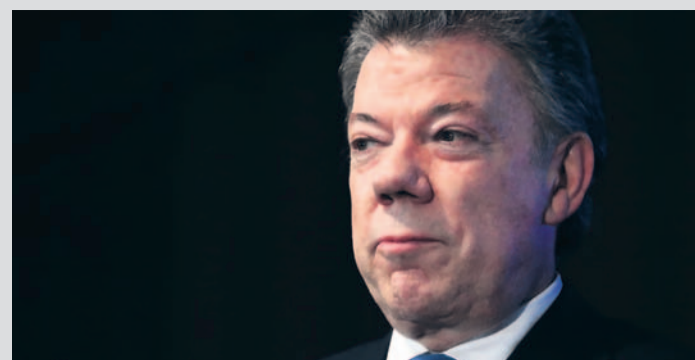
SVIENDE NEDERLAG: Colombias president, Juan Manuel Santos.

ansvaret for å markedsføre Norge som reisemål for turister. I år fikk de 231,5 millioner for å gjøre den jobben. Pengepotten man nå ber om skal komme på toppen av de midlene. Om regjeringen tenner på ideen til Innovasjon Norge, ber de om å få utbetalt 80 av de 332 millionene allerede i 2017.